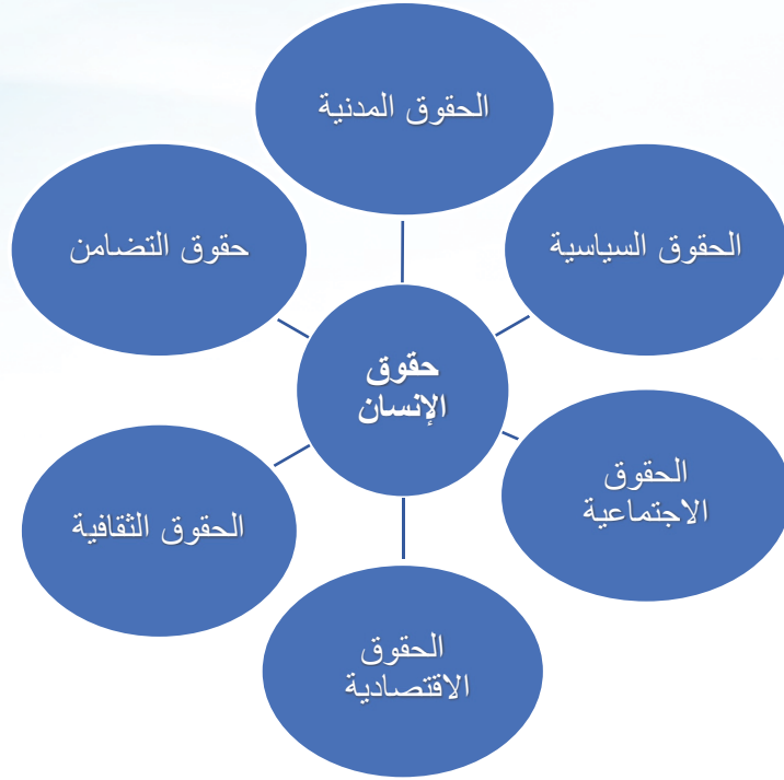
المخطط (١) أنواع حقوق الإنسان وصورها